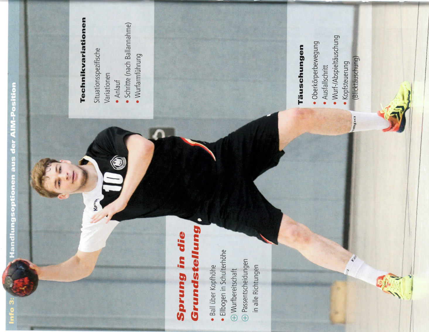
Info 3: Handlungsoptionen aus der AIM-Position